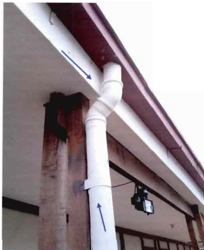
Imagen N°06 – Bajada de Agua en PVC.