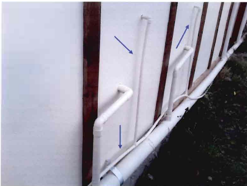
Imagen N°10 – Cañerías de Agua Potable a la intemperie.