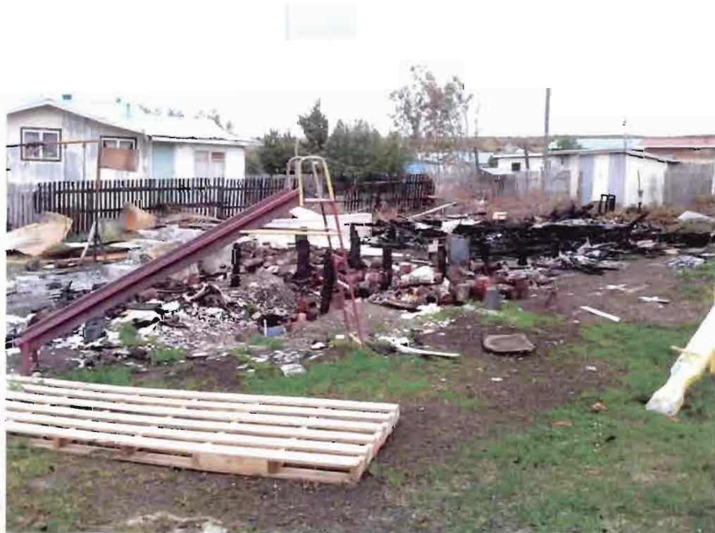
Imagen N°16 – Vivienda Fiscal siniestrada.