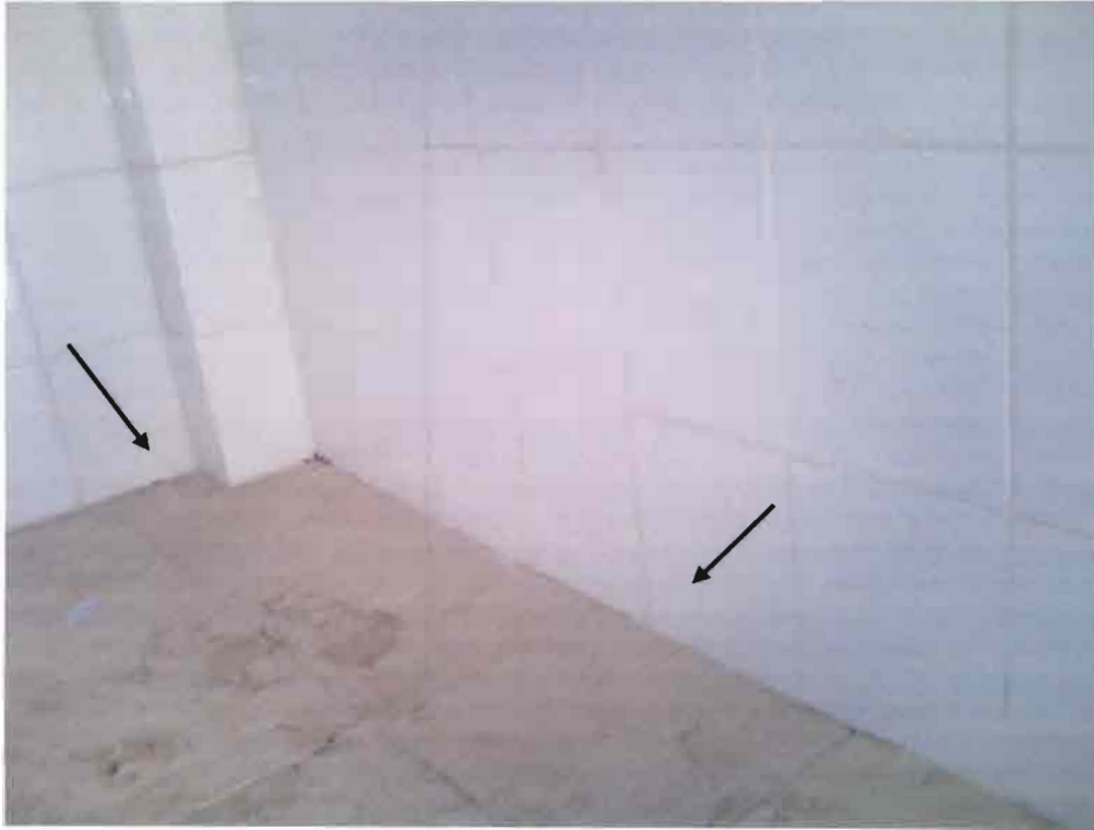
Imagen N°07 – Guarda de Cerámica faltante.