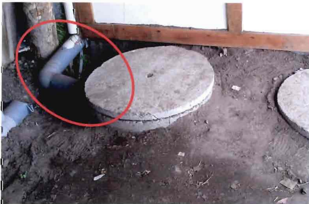
Imagen N°04 – Ducto cámara.