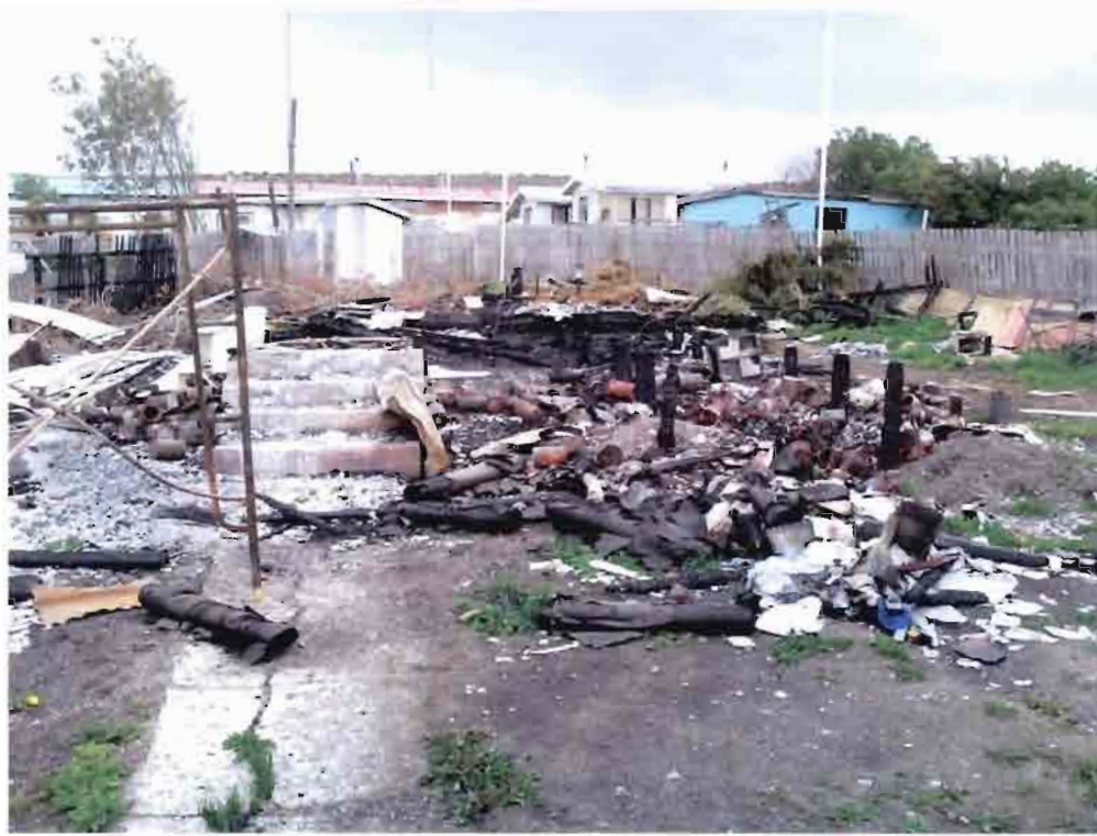
Imagen N°15 – Vivienda Fiscal siniestrada.

Obra “Mejoramiento Complejo Municipal, I. Municipalidad de Laguna Blanca”