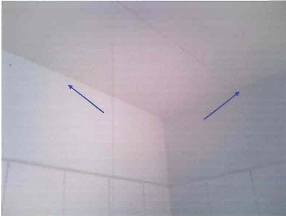
Imagen N°09 – Cornisas faltantes.