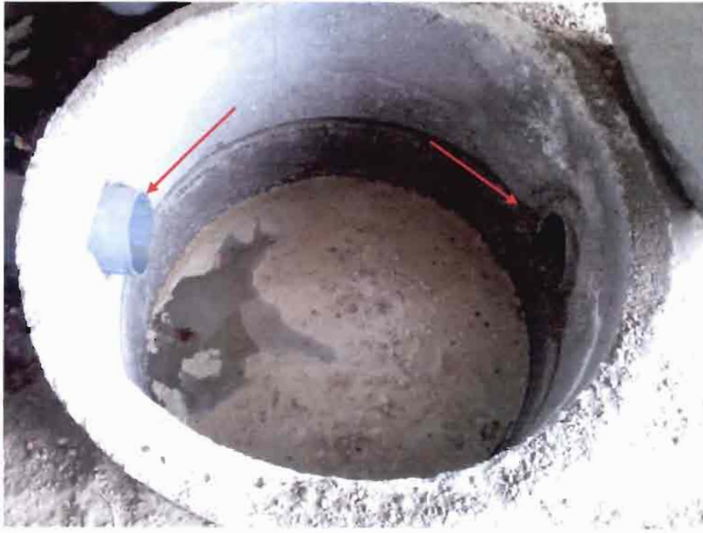
Imagen N°03 – Cámara Desgrasadora.