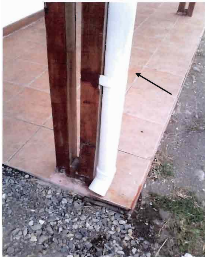
Imagen N°05 – Bajada de Agua en PVC.