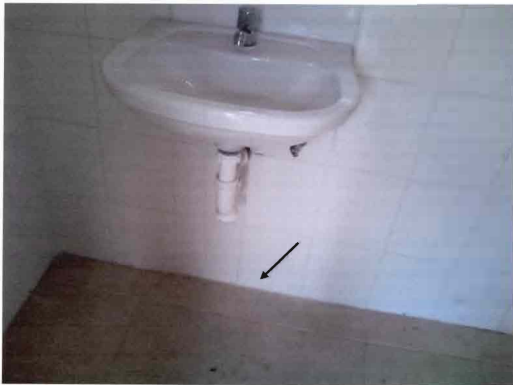
Imagen N°08 – Guarda de Cerámica faltante.