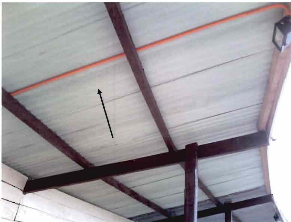
Imagen N°11 – Ausencia de papel fieltro y disminución de costaneras.